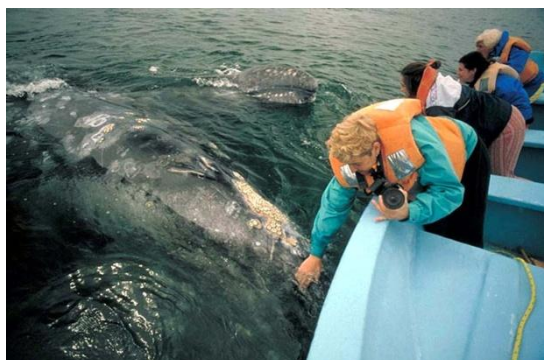
Contatto con una Balena Grigia nella Laguna di San Ignacio

La fauna selvatica in Baja è numerosa e diffusa. Con la conoscenza di specifiche tecniche di avvicinamento e la conoscenza del luogo e dell'ora giusti le nostre guide renderanno possibili incontri unici ed indimenticabili con otarie, balene, coyotes, gatti selvatici, antilopi, rapaci, serpenti e sonagli ed altri animali. In Natura nulla è scontato, molto del successo dei nostri incontri sta anche nel rispetto delle istruzioni della guida, nel silenzio e nella paziente attesa.