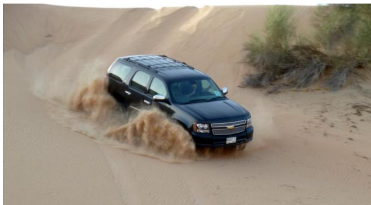
Lo Chevrolet Suburban sulle dune di sabbia